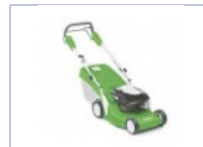
Tosaerba Viking 299 €